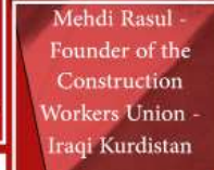
Mehdi Rasul - Founder of the Construction Workers Union - Iraqi Kurdistan