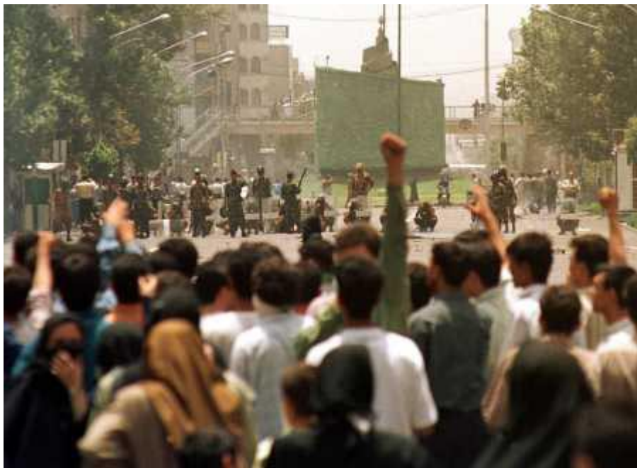
مرگ بر جمهوری اسلامی آزادی زندانی سیاسی زنده باد جمهوری سوسیالیستی

رژیم اسلامی دیروز ۱۸ تیر در بسیاری از شهرهای ایران با تظاهراتی چنددههزارنفری روبرو شد. در تهران در نقاط مختلف شهر از جمله در میدان انقلاب، میدان ولیعهد، میدان محسنی، میدان دانشجو، میدان جمهوری، پارک لاله، خیابانهای ۱۲ فروردین، ۱۶ آذر، وصال شیرازی و کارگر، جمعیتی تا ۲۰ هزار نفر به خیابان آمدند و علیه جمهوری اسلامی دست به تظاهرات زدند. تظاهرات کنندگان علیرغم حضور سرکوبگران اسلامی با شعارهای مرگ بر جمهوری اسلامی، توپ، تانک فشفشه خامنه ای کشته شه، آزادی اندیشه با ریش و پشم نمیشه، آزادی زندانی سیاسی و شعارهای بسیار دیگری علیه خاتمی خشم و نفرت خود را از این حکومت استبداد مذهبی اعلام داشتند. شهر تهران دیروز شاهد تکرار صحنه های اعتراضات توده ای مردم برای