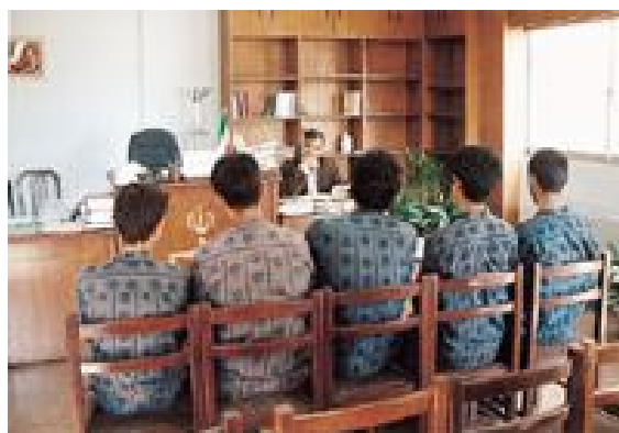
دادگاه اطفال در تهران

گذشتن دوران اولیه کودکی، به جنگ رژیم اسلامی برای دفاع از حق زندگی و شادی آمده است. حربه آنها رقص و پایکوبی و زیرپا گذاشتن مقررات اسلامی در زندگی خصوصی و اجتماعی شان است. این نسل اما پس از تجربه دو دهه حاکمیت فاشیسم اسلامی، خشمگین به