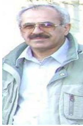
مجدد حسینی: پروژه حضور

رهبران کمونیست در میان مردم به ابتکار منصور حکمت شروع شد و تا کنون کمیته کردستان حزب با موفقیت تمام آن را در شهرها و مناطق دیگر کردستان به پیش برده است. این پروژه ای است ادامه دار و وسیع جزیی از پراتیک و جهت عمومی ناظر بر فعالیت ما است. این برنامه الگو و حلقه کوچکی از پراتیک جنبش حکمتیسم برای ساختن حزب سیاسی در راستای تنوری حزب و جامعه و حزب و قدرت سیاسی است. هنوز روش های فعالیت متنوع تر و مسیر های زیادی از این قبیل هست که باید شناخت و پیدایشان کرد. تا با شتاب بیشتری حزب را به یک حزب تمام عیار سیاسی و موثرتر، دخیل تر در جامعه تبدیل کرد و بتوانیم به موقع به نیازهای سیاسی مبارزه مردم جواب دهیم. تا همین جا خوب جلو آمده ایم. این الگو را باید با اتکا به تجاربی که داریم، کامل کرد و گسترش داد.