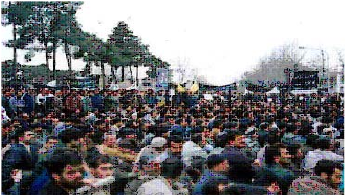
عکس از یکی از تجمعات کارگران در تهران