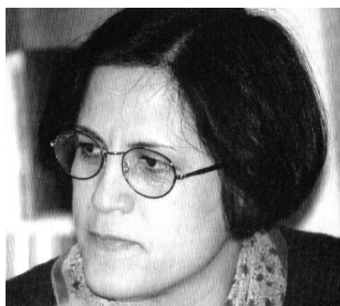
اعظم کم گویان

جمهوری اسلامی سالانه چندین بار مراسم اعدام را رسماً با بر پا کردن چوبه های دار در ملا عام به اجرا در می آورد. این رژیم رکود صد هزار نفری در اجرای اعدام دارد. در عربستان سعودی جمعه هر هفته پس از اخبار شب، گوینده تلویزیون بیانیه رسمی وزارت کشور در مورد افرادی که طی هفته گذشته با شمشیر سرشان را در ملا عام در میدان مخصوص اینکار از تن جدا کرده اند، را به اطلاع مردم می رساند. دولت عربستان در سالهای ۱۹۹۹ و ۲۰۰۰ سر ۲۱۰ نفر را با شمشیر اسلام از تن جدا کرد. عربستان سعودی یکی از جوامع بسته و مخوف اسلامی است و دولت آن اعلام کرده که شریعت اسلام با اجرای مجازات اعدام، عدالت را برای همه تأمین می کند. در ایران جمهوری اسلامی رسماً اعدام ۲۱۵ نفر را در سال گذشته اعلام کرده و تعدادی از این احکام را با دار زدن بوسیله جرتیل در ملا عام به اجرا آورده است. اما نه این ارقام و واقعیات هولناک را بیان می کنند و نه مجازات اعدام منحصر به جوامع مشابه ایران و عربستان سعودی است. در سال گذشته ۳۸۵۷ نفر در ۶۳ کشور جهان اعدام شده اند. در بیش از ۹۰ کشور جهان مجازات اعدام، قانونی تثبیت شده و لازم الاجراست و سه دولت بزرگ دمکراسی دنیا یعنی آمریکا، ژاپن و هند از طرفداران و مجریان سرسخت آن هستند. در آمریکا جامعه ایده آل دمکراسی و سرمایه داری از سال ۱۹۷۶ که مجازات اعدام مجدداً در آن احیا شد اعدامها هر سال رو به افزایش بوده و چندین هزار نفر در انتظار اجرای حکم اعدام بسر می برند. اعدام یکی از جلوه های تلخ و سیاه تاریخ زندگی بشر است و هر زمان که حرمت و ارزش زندگی انسان در جامعه افت کرده، اعدام هم رواج بیشتری یافته است. اعدام قتل عمدی است از پیش برنامه ریزی شده و هدف از تثبیت و اجرای آن وادار کردن مردم و جامعه به اطاعت از